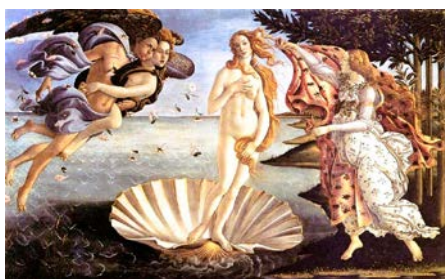
Geboorte van Venus, Botticelli

Enkele van de mooiste liefdesverhalen uit de Griekse mythologie worden in beeld gebracht aan de hand van het werk van vele kunstenaars. Hoe verging het Pygmalion, Adonis en anderen? Allereerst horen en zien we hoe de godin van de liefde, Aphrodite, tot leven kwam en hoe ze zelf met haar geliefden als Ares, Hephaistos en Adonis omging.