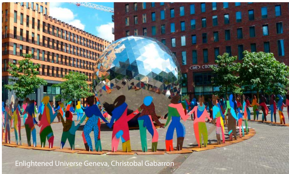
Enlightened Universe Geneva, Cristobal Gabarron