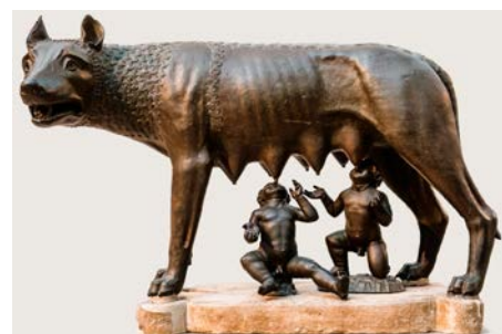
Romulus en Remus en de wolf

De Trojaanse Oorlog was een gruwelijke, met een nog afschuwelijker einde voor de Trojanen, met name de vrouwen. Hoe ontstond die oorlog en hoe verging het de hoofdrolspelers als Agamemnon en Odysseus? Hoe verging het Trojaanse vrouwen als