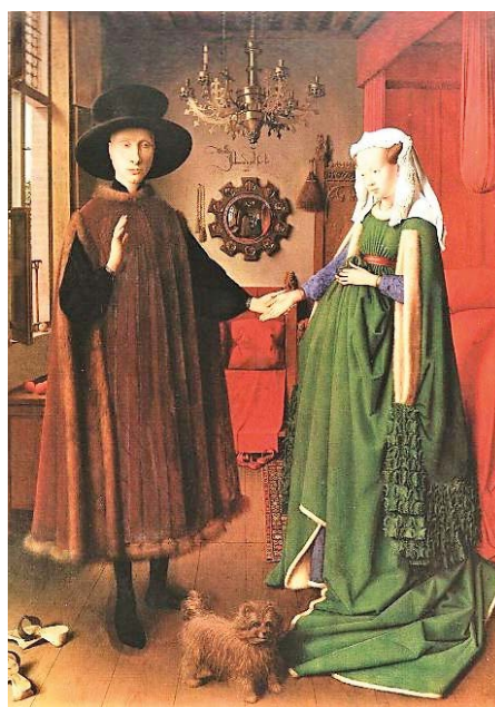
Jan van Eyck – Arnolfini Portret

In ongeveer veertien bijeenkomsten wordt met powerpointpresentaties het leven en werk van enkele van de belangrijkste vertegenwoordigers van de Vlaamse Primitie-