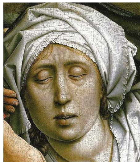
Rogier van der Weyden – Kruisafneming (detail)