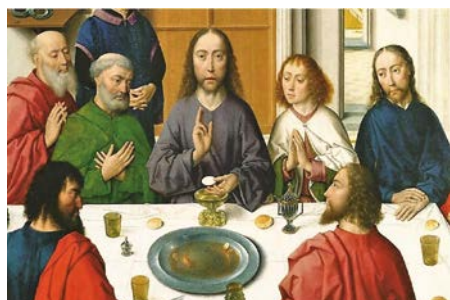
Dirc Bouts – Laatste Avondmaal (detail)